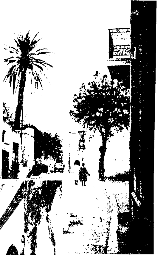
Fig. 1. — La Rue des Andalous (au milieu de la chaussée, jeune farçon jouant de la flûte de roseau)

Le Bardo, en arabe El-Bardou , est une déformation de l'espagnol