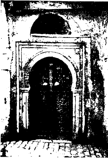
Fig. 4. — TUNIS — Porte cloutée avec encadrement en pierre

D'autres de ces noms sont venus de l'extérieur : El-Grigui, « le Grec »; Es-Sakali, « le Sicilien »; El-Barouni, « le baron »; El-Fourati, « le fort ».