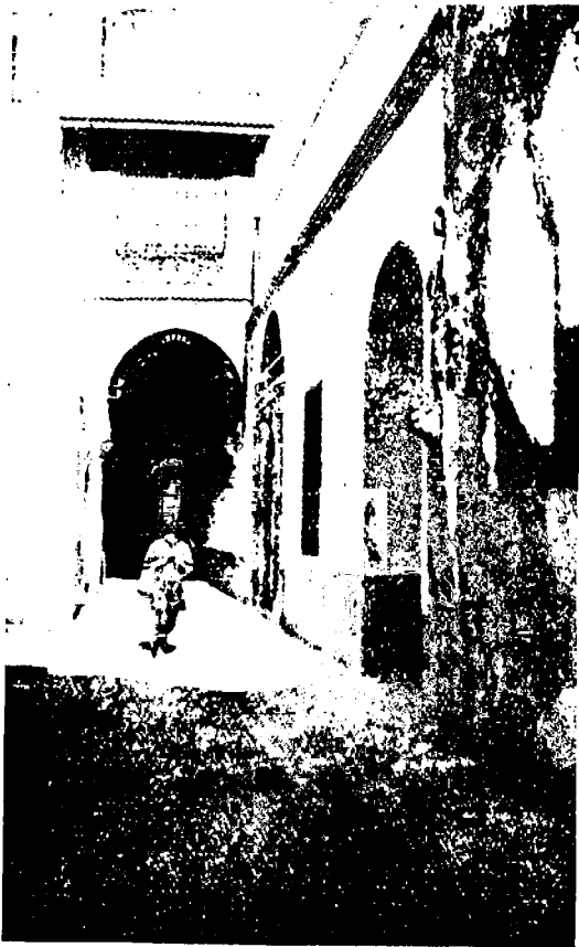
Fig. 2. — Entrée de la Rue Abdul-Wahab

el-prato, « le jardin clos », venu lui-même du latin pratum , qui a donné aussi le français « pré ». Le Bardo est une ancienne résidence beylicale, probablement d'origine hafside : on y voit encore la salle des réceptions officielles de S. A. le Bey; une caserne de la garde beylicale et plusieurs salles contenant les collections archéologiques du Musée Alaoui de Tunis.