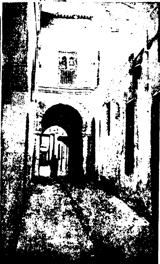
FIG. 4. — Tunis. — Passage voûté ou « çabâth » s'appuyant sur des piliers, dans la rue des Marchands d'Huile.

Les noms de saints musulmans qui ont servi à désigner les rues sont aussi extrêmement nombreux (plus de cent çinquan-