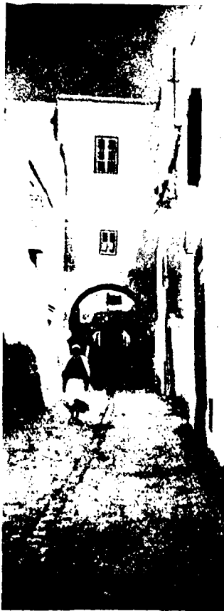
FIG. 3. — Tunis. — Passage voûté ou « çabâth » s'appuyant sur les deux murs de la rue, dans la rue Tourbet-el-Bey.