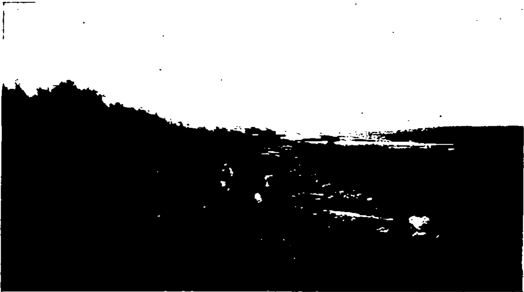
'Aïn Bkhout, près d'Okkacha (Rive gauche de l'Ouargha).