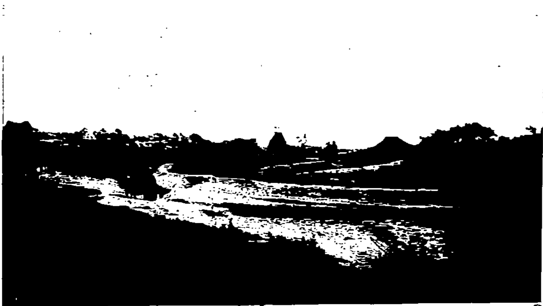
Douar des Oulad Douggan, entre le Souq el-Djouma'a de Qassarar et le gué de Bel-Qciri.