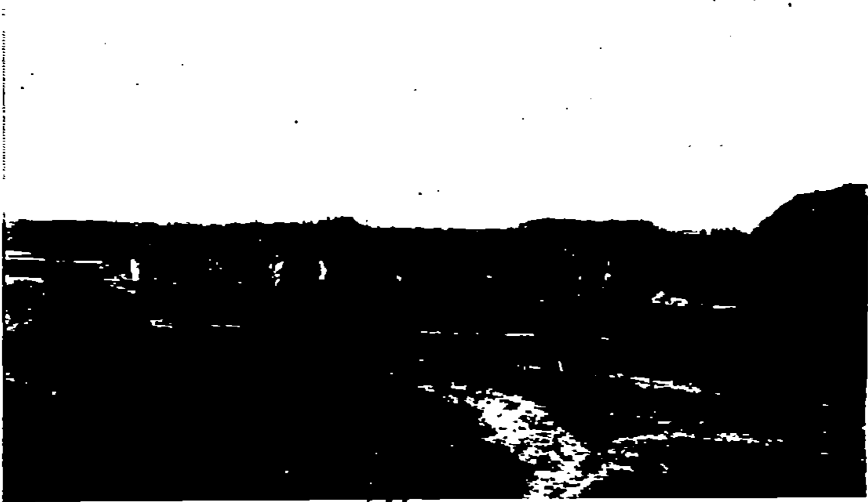
Maison de feu le Qaïd Et-Tayyeb Bel-Cherqaoui, Qaïd des Beni Malek, au village des Tafaoutiya, près l'Arba'a de Sidi 'Aïsa (côté est).