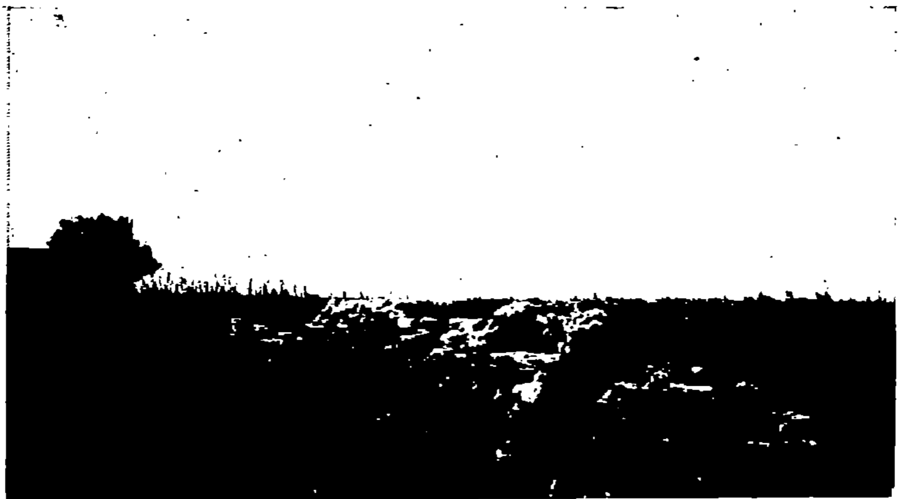
Ruines près de Sidi Ali Bou Djenoun (Colonia Ælia Banasa).