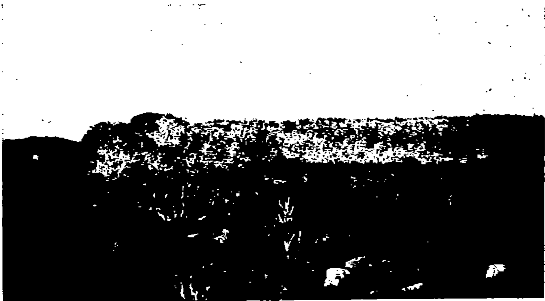
Ruines de Baçra.