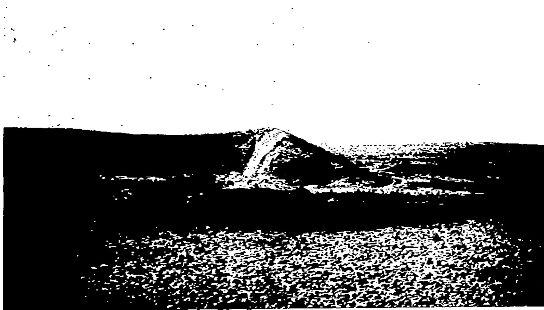
Salines près de l'Oued Sida, sur la route de Sidi 'Aïsa.