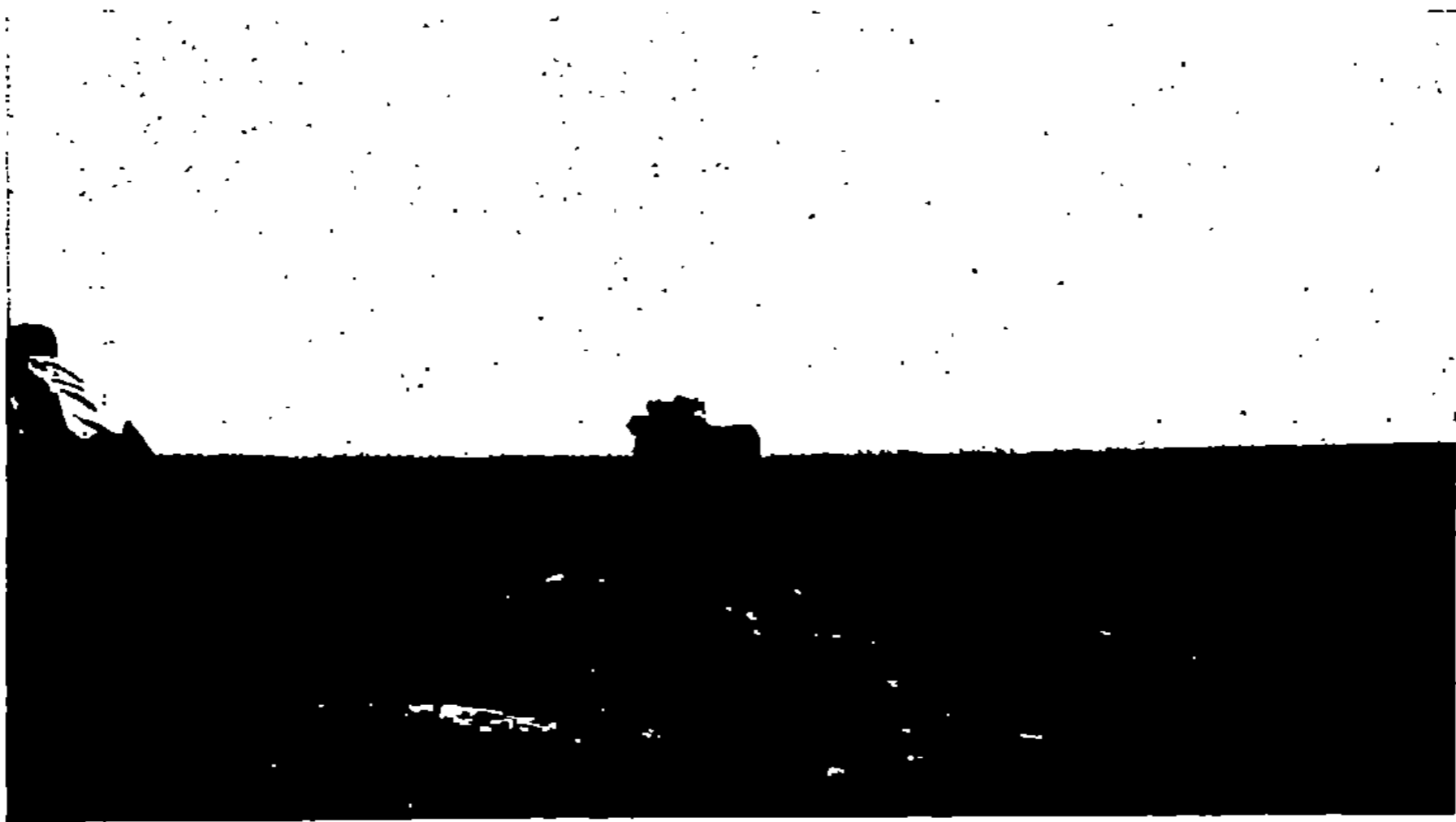
Sidi Ali Bou Djenoun (Colonia Ælia Banasa.)