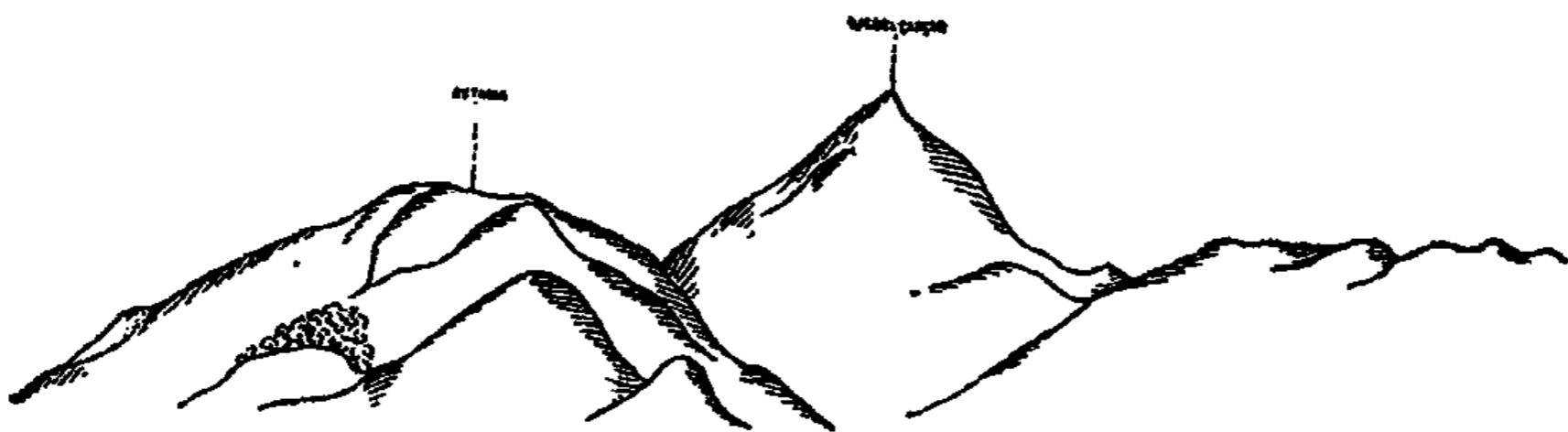
Vue des Ketama et du Djebel Çarçar prise de Zahdjouka du Tliq.

Le territoire du Djebel Çarçar est borné au nord par l'Oued Lekkous; sur la rive droite de la rivière, se trouve, dans le Sérif, le village des Beni Khallad, et en face de lui, sur la rive gauche, en territoire Çarçar, le village de Demna.